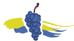
STOWARZYSZENIE WINIARZY MAŁOPOLSKIEGO PRZEŁOMU WISŁY